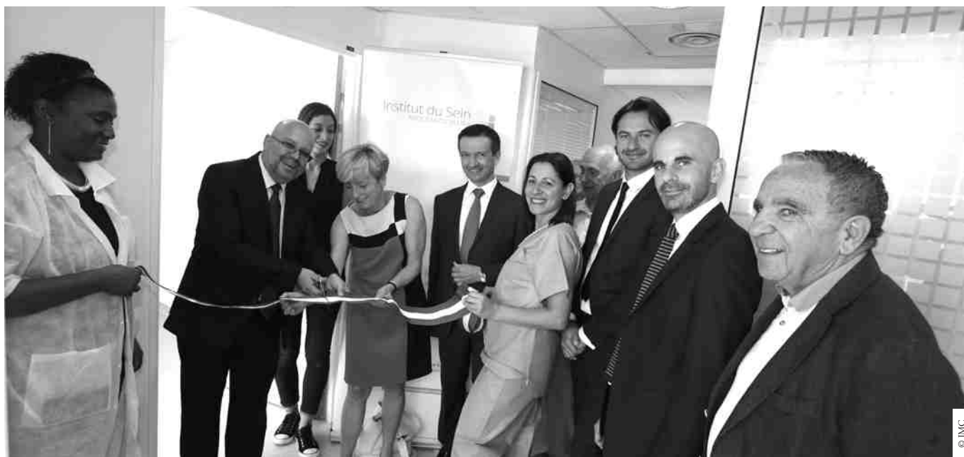
Philippe Pradal, maire de Nice, est venu inaugurer l'Institut du sein Santa-Maria.

"Le cancer du sein est une maladie qui se guérit dans 85 à 90% des cas. Plus le diagnostic est précoce, plus les chances de guérison sont grandes". Ce message d'espoir, c'est celui de toute l'équipe de l'Institut du sein qui vient s'ouvrir à la polyclinique Santa-Maria.