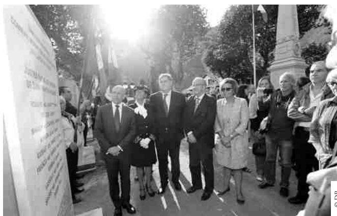
Lors du dévoilement des stèles..

"C'est la première fois que dans notre pays ce double hommage est rendu. C'est un signe fort. C'est une immense fierté pour nous tous" a déclaré Eric Ciotti. " Ces stèles rappellent que des femmes et des hommes exemplaires et courageux, dans les pires moments de notre histoire, ont pris le risque de dire non à la barbarie nazie, à la dés-humanisation, à l'antisémitisme